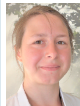
Haentjens Aster Zorgkundige Mobbiele Equipe Sinds 20/07/2020