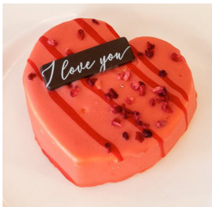
Een valentijnsgebakje als dessert

Om 12 uur werd iedereen verwelkomd met een glaasje bubbels of fruitsap. Daarna werden ze verwend met een heerlijk diner.