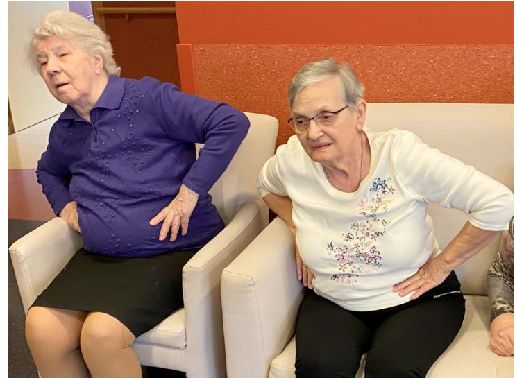
De armen in de lucht, draaien met die heupen,... Iedereen deed goed mee.