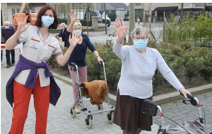
De dames van het dagverzorgingscentrum wandelden met plezier mee.

Op het voetpad langs de Dreef daarentegen vonden we die wel. Auto's stonden te dicht geparkeerd waardoor het moeilijk was om op het voetpad te blijven en de wortels van de bomen duwden het voetpad omhoog. Het was een leerrijke wandeling en we hopen dat ons gemeentebestuur de Dreef wat 'valveiliger' maakt. Het was tof om nog eens in grote groep samen te wandelen.