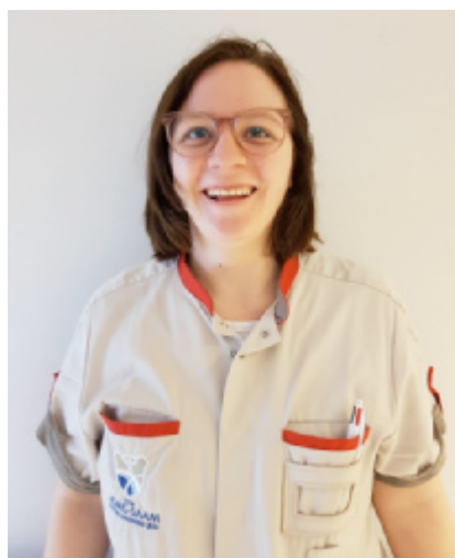
De Backer Frizien Zorgkundige Mobiele equipe