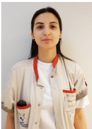
Kahya Aysel Zorgkundige Mobiele equipe