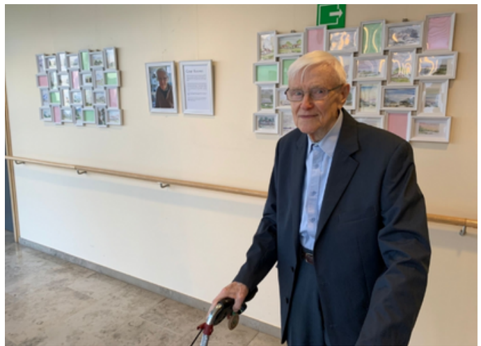
in het woonzorgcentrum Ons Zomerheem in Zomergem loopt er nometeel wel een heel bijzondere tentoonstelling.