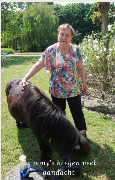
De pony's kregen veel aandacht