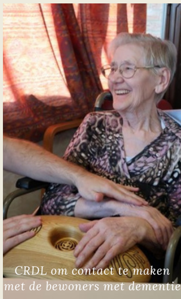
CRDL om contact te maken met de bewoners met dementie

Daarnaast organiseerden we nog een aantal bijkomende activiteiten: ritjes op de duofiets , wellnessdag met de 6e jaar studenten en CRDL om contact te maken met onze bewoners met dementie. CRDL is ontwikkeld als hulpmiddel om sociaal isolement te doorbreken en verbinding tot stand te brengen. Het creëert een vorm van gelijkwaardigheid waarbij iedere deelnemer de kans krijgt om op zijn eigen manier te genieten van de nabijheid en energie van de ander, los van cognitief vermogen.