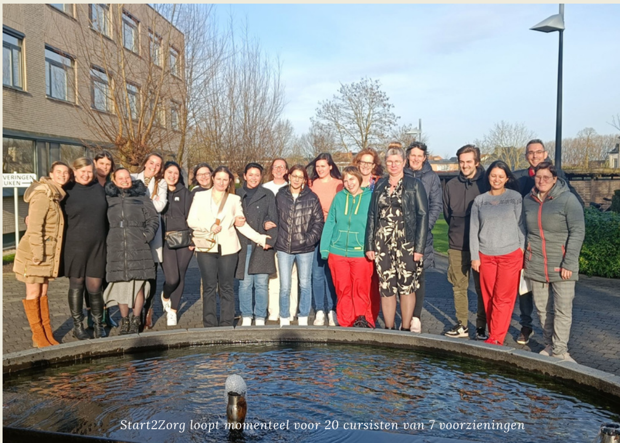
Start2Zorg loopt momenteel voor 20 cursisten van 7 voorzieningen

Met deze ervaring wenst Zorg-Saam eigen medewerkers leerkansen te geven en wordt onze werkvloer ook een beetje een opleidingsvloer. We nemen onze maatschappelijke verantwoordelijkheid op en werken tegelijk aan de uitdagingen die zich stellen op vlak van instroom. Een win-win, die naar meer smaakt... misschien in de toekomst... misschien in een andere regio... We houden vinger aan de pols!